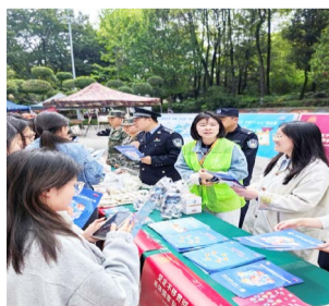
▲ 4月15日，学校开展2026年全民国家安全教育日暨“国家安全宣传教育月”系列活动。