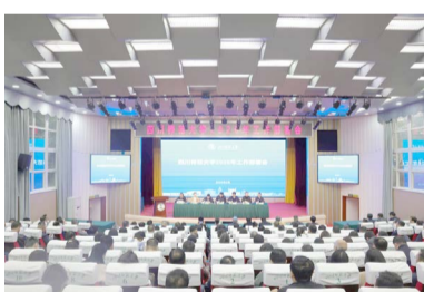
▲ 2月27日，学校在狮子山校区学术报告厅召开2026年工作部署会。