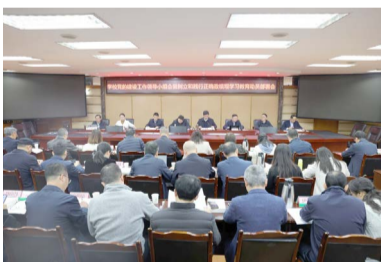
▲ 3月6日，学校党委在狮子山校区7教A区六楼会议室部署启动树立和践行正确政绩观学习教育。