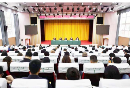
▲ 4月22日，省委第二巡视组巡视四川师范大学党委工作动员会在狮子山校区学术报告厅召开。