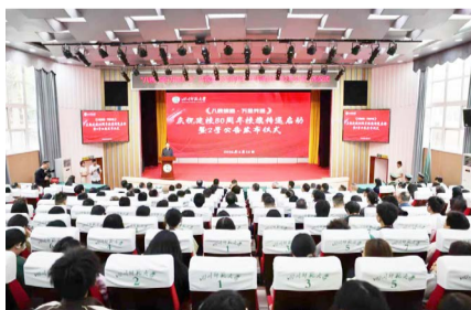
▲ 4月16日，学校在狮子山校区学术报告厅举行建校80周年校旗传递启动暨2号公告发布仪式。