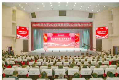
▲ 1月9日，学校在成龙校区龙湖剧场隆重举行2025年度表彰暨2026新年庆祝活动。